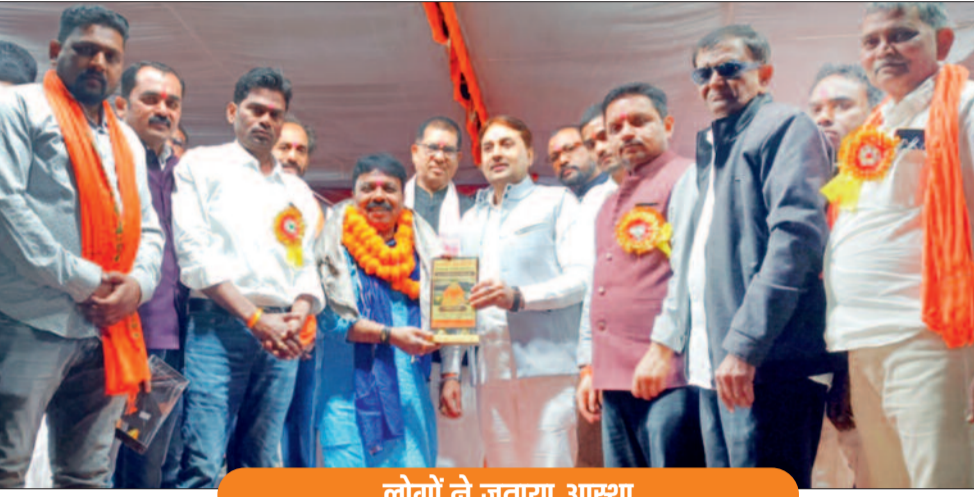
लोगों ने जताया आस्था

धर्मस्व एवं पर्यटन विभाग के सहयोग से नर्मदा में आयोजित तीन दिवसीय माघ पूर्णिमा मेला महोत्सव का रविवार को समापन हुआ। पर्व के दौरान श्रद्धालुओं की भीड़ उमड़ी वहीं कला का प्रदर्शन देखने को मिला। हजारों श्रद्धालुओं ने माता रानी का दर्शन एवं पुनी स्नान कर अपनी आस्था प्रकट किया साथ ही ऐतिहासिक मेला का आनंद लिया।