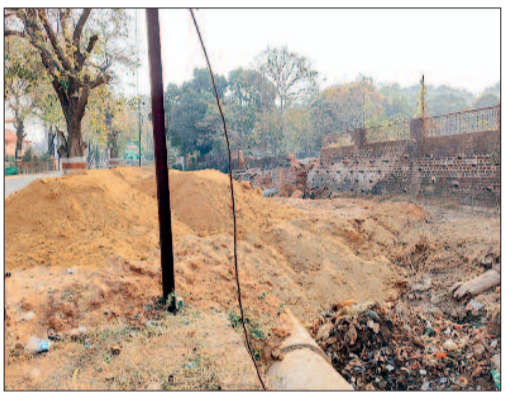
पार्षद की अनदेखी

नाले पर खुलेआम अतिक्रमण करने से नगर पालिका की कार्यप्रणाली पर गंभीर सवाल खड़े हो गए हैं। वार्ड 2 स्थित पाइप फैक्ट्री के संचालक ने नाले और सरकारी जमीन पर कब्जा कर लिया है। हैरानी की बात यह है कि इतना सब होने के बाद भी पालिका के अधिकारी मौन हैं। लोगों का कहना है कि अतिक्रमण के बाद भी कार्रवाई नहीं की जा रही है जिससे वार्डवासियों में भारी नाराजगी है। नाले पर अतिक्रमण होने से लोगों की चिंता बढ़ रही है। वार्डवासियों के अनुसार पहाड़ी क्षेत्र से आने वाला पानी नाले में जाता है। नाले से अतिक्रमण नहीं हटया गया तो मानसून के दिनों में पानी दंतेश्वरी पारा के निचले हिस्सों में फैल सकता है, जिससे बाढ़ जैसी स्थिति बनने की आशंका है। इस वार्ड में दर्जनों परिवारों के घर मिट्टी के हैं जो पानी भरने से प्रभावित हो सकते हैं।